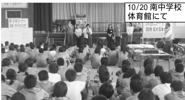
10/20 南中学校 体育館にて

～大規模体験学習オープニングより～ 深谷市立南中学校と協働で進めてきた学民ジョイント第4・5回目は、体育館・美術室・武道場を使っての大規模体験学習でした。 会場を「わたしたちが住んでいるまち」に